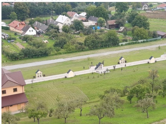
Rozhľadňa v areáli pútnického miesta