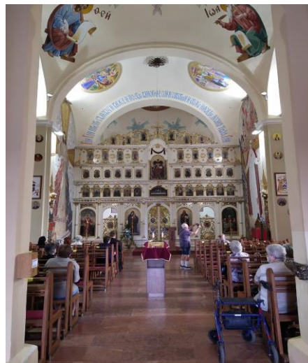
Mini skanzen drevených kostol